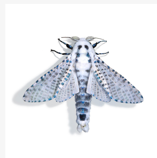
Zeuzera pyrina Lepidoptera: Cossidae

El producto ZEUTEC está constituido por un difusor de vapores de feromona. Las