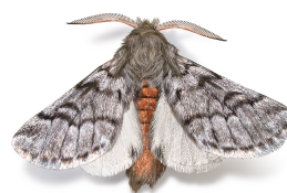
Thaumetopoea pityocampa Lepidoptera: Thaumetopoeidae

Durante el verano tiene lugar la emergencia de los adultos. La hembra deposita los huevos (200 unidades) sobre las agujas de los pinos y los protege con escamas del abdomen. Las orugas nacen al cabo de un mes. Tras cuatro mudas forman la bolsa definitiva a principios de invierno. Allí estarán hasta finales de febrero para empezar el descenso para enterrarse y pupar. Presenta una sola generación al año. Los daños son originados por las larvas que se alimentan de las agujas del pino causando defoliación y debilitamiento del árbol haciéndolo más indefenso frente a hongos y otros insectos. Por otro lado, las orugas están recubiertas de pelos urticantes que quedan dispersados en el aire y sobre el suelo.