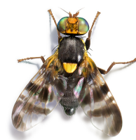
Rhagoletis cerasi Diptera: Tephritidae

Uno de los métodos alternativos recomendados es el trampeo masivo. Esta técnica consiste en atraer a los adultos hacia el interior de una trampa con un atrayente